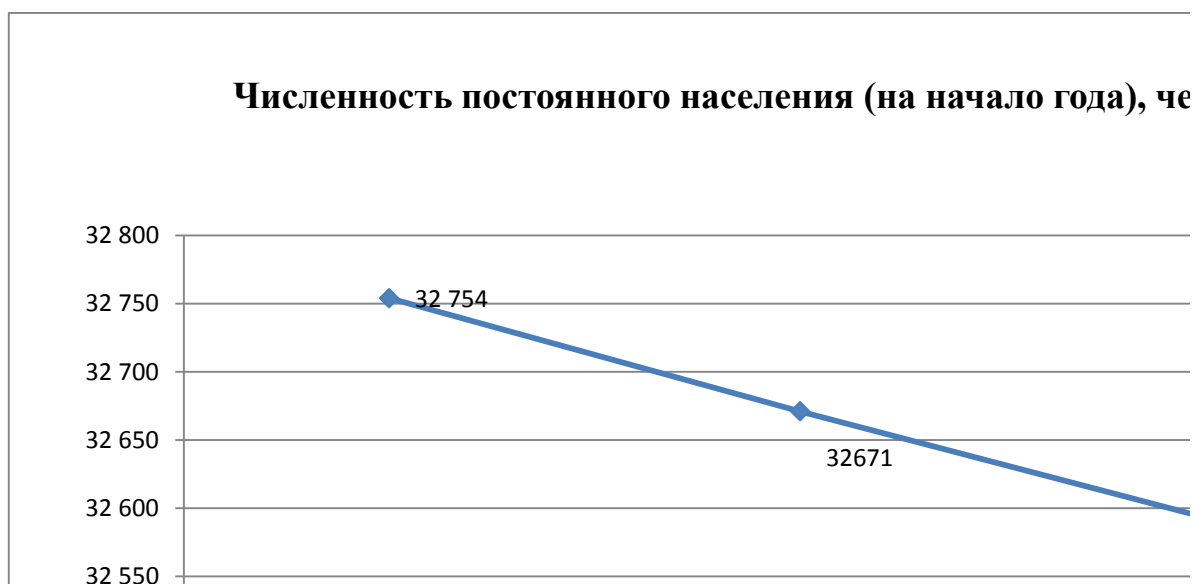
Динамика численности населения муниципального образования «Тайшетское городское поселение»

Динамика численности населения Тайшета неблагоприятна, что, однако, соответствует тенденциям демографического положения Иркутской области, в целом. За три года с 01 января 2018 по 01 января 2021 года численность населения города уменьшилась на 162 чел., то есть среднегодовая убыль населения составила 0,5 %. Убыль населения обусловлена как естественной убылью, так и отрицательным миграционным потоком. Число умерших в Тайшете в 1,42 раза превышает число родившихся: родилось за 3 года 1198, умерло - 1598 человека. Вместе с тем, такой же вклад в общую убыль населения вносит миграционный отток: с 01 января 2018 по 01 января 2021 года он составил 51 человек.