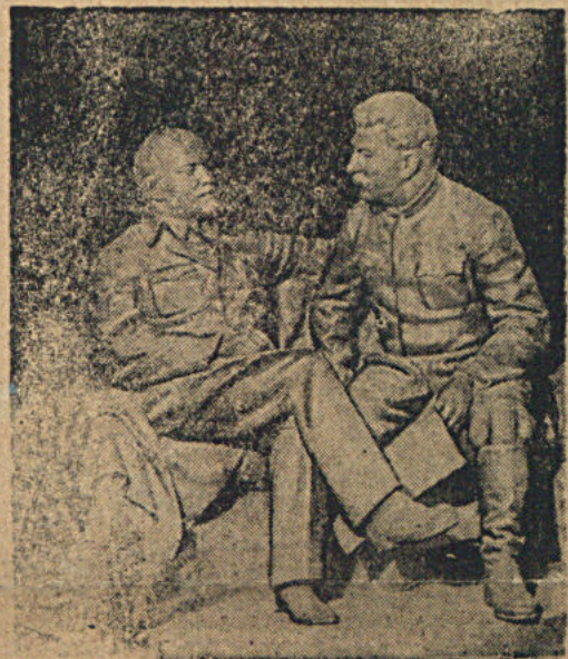
На снимке: скульптура—В. И. Ленина и И. В. Сталина в Горках

В честь 20-летия Великой Октябрьской Социалистической революции в Киеве открылась художественная выставка „Цветущая Социалистическая Украина“