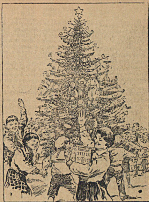
Советской детворе — веселые елки