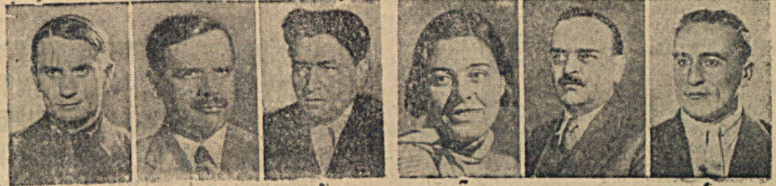
Товарищ АНДРЕЕВ Андрей Андреевич (в центре) — депутат Совета Союза Верховного Совета СССР от Джизгакского избирательного округа Туркменской ССР, член Политбюро и секретарь ЦК ВКП(б), единогласно избран на первом заседании Совета Союза председателем Совета Союза Верховного Совета СССР.

От Совета старейшин Совета Союза и от совета Старейшин Совета Национальностей выступает с предложением депутат