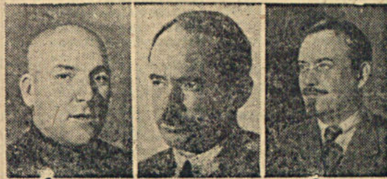
На снимке (слева направо)