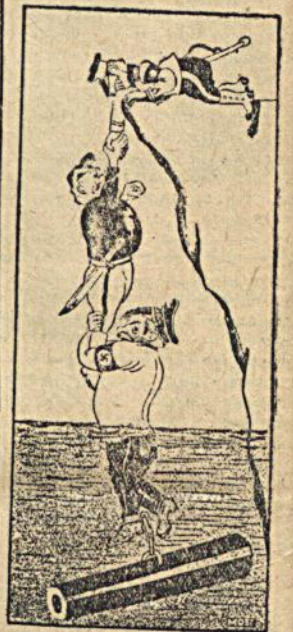
Тройственный союз не спасет! Рис. М. Отарова.

(Из речи т. Молотова на собрании Молотовского избирательного округа 8-ИИ—37 г.