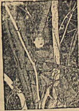
На страже дальневосточных границ. На снимке: Боец И-ского пограничного отряда Т. М. Покохов в лесу.