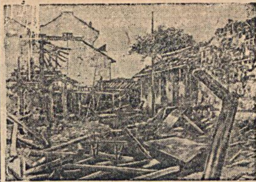
Рабочее предместье Пей-Джин-Чин, разрушенное японской бомбардировкой.