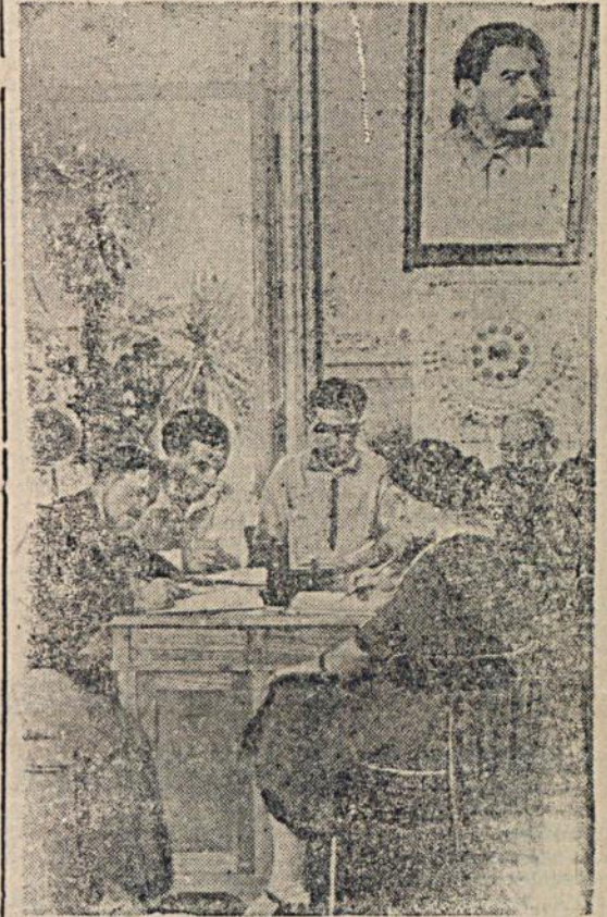
В кабинете агитации и пропаганды.

В Сухуми (Абхазская АССР) в заново отремонтированном здании открыт дом партийного просвещения. Здесь хорошо оборудованы: библиотека, читальня, зал заседаний, учебные кабинеты, комнаты для консультаций, индивидуальных занятий и пр.