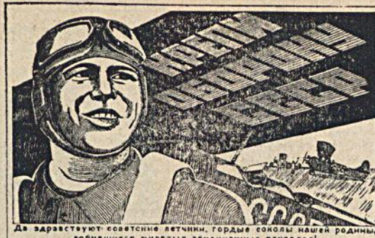
Да зарастают советские летчики, когда самолеты нашей родины добьются мировых авиационных рекордов! Участвием в 12-й лотерее крепите Осоавиахимовскую авиацию!

На снимке: Плакат художника А. Бельского, выпущенный к 12-й лотерее Осоавиахим.