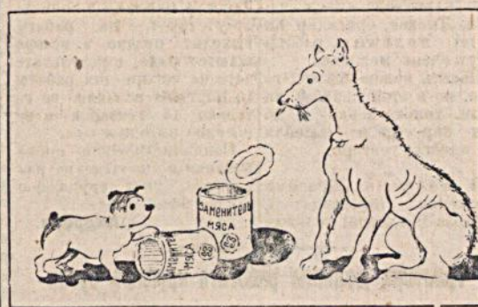
Рис. М. Отарова.