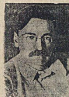
На снимке: В. Р. Менжинский.

10 мая исполняется 4 года со дня смерти непоколебимого бойца шевка; верного сына партии Ленина-Сталина Вячеслава Рудольфовича Менжинского. Стальной чекист В. Р. Менжинский, находившийся на посту председателя ОГПУ, был злодейски умышленно фашистскими бандами из „право-троцкистского блока“