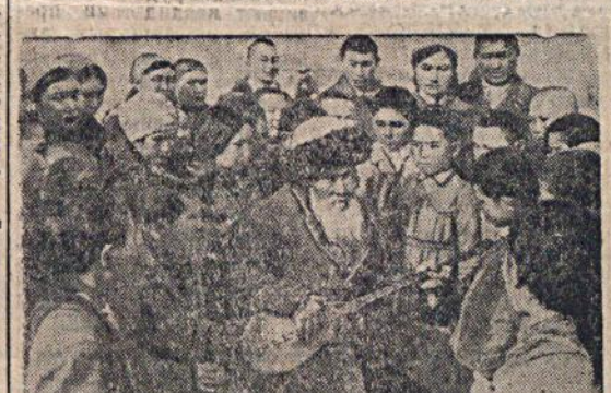
Народный певец Казахстана Джамбул в кругу юных слушателей школьников колхоза «Ернар» Каптынского района Алма-Атинской области.

К 75-й годовщине литературной деятельности выдающегося акима, народного певца Казахстана, орденоснца Джамбула.