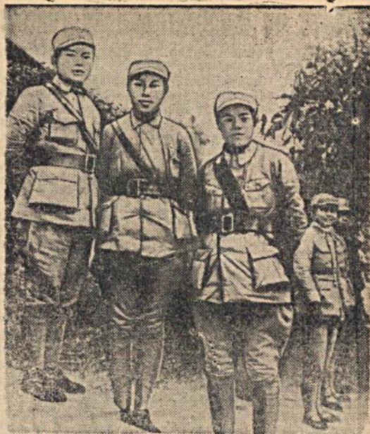
Девушки — офицеры китайской армии, пришедшие на фронт из учебных заведений.