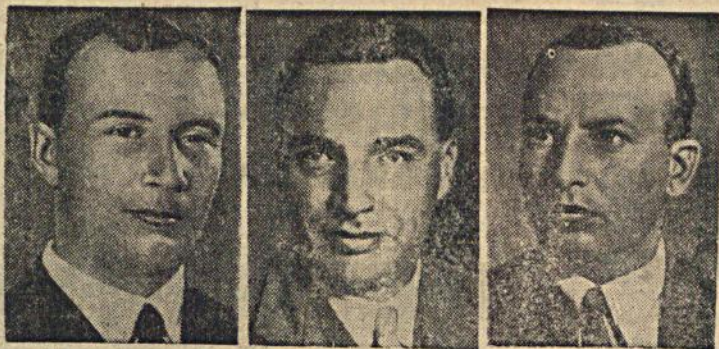
На снимке (слева направо): герои Советского Союза А. Беляков, В. Чкалов и Г. Байдуков.

Перелет начался в 4 ч. 05 минут 18 июня. 20 июня в 19 ч. 30 минут (по московскому времени) героическая тройка совершила посадку на аэродроме Баракс, близ Портланда (штат Вашингтон).