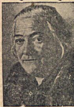
На снимке: Клара Цеткин.

20 июня 1938 г. исполняется 5 лет со дня смерти Клары Цеткин выдающейся деятельницы международного коммунистического движения.