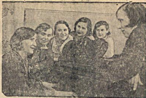
Почвой санаторий „Большевик“ в Володарском районе Ленинграда пропускает в год сотни трудящихся. По окончании работы отдыхающий спит в санаторий, где его ждут питательный обед, лечение и отдых. За 40 дней, проведенных в санатории, отдыхающий значительно прибавляет в весе и улучшает свое здоровье. На снимке: Группа отдыхающих работников и стахановцев у роля, в комнате отдыха санатория.