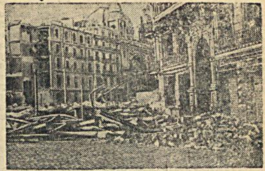
На снимке: Здание кино-театра „Коллизей“ разрушенное бомбардировкой

Варварская бомбардировка Барселоны итало-германскими интервентами,