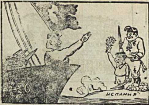
Вывод последнего итальянского солдата. (Вариант предлагаемый Муссолини)