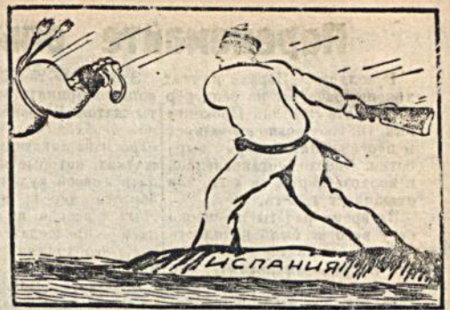
„Вывод“ последнего итальянского солдата (Вариант испанского народа) Рис. М. Отарова („Прессклише“)

Однажды она повела своих товарищей в тыл неприятельской части