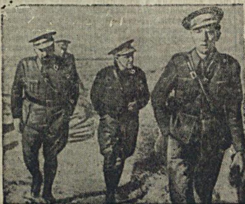
Генерал Эль-Кампесино (слева) к началу войны с фашистами был крестьянином, сейчас он — известный командир республиканской дивизии