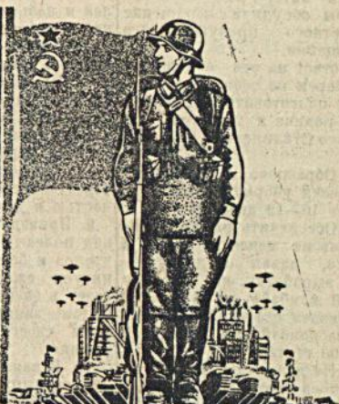
Мы стоим за мир и отстаиваем дело мира, но мы не боимся угроз и готовы ответить ударом на удар поджигателей войны. Сталин

Рис. с плаката художника Янг. Госуд. Издательства „Искусство“ Пресеклише.