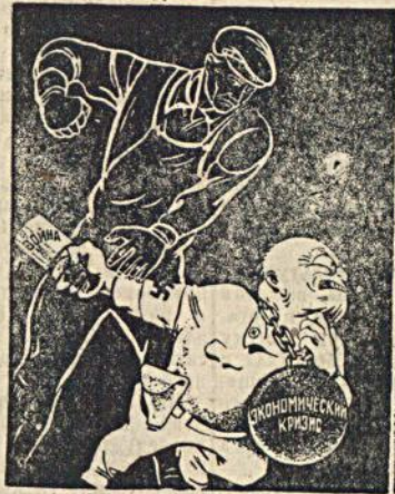
Фашисты готовят нападение на Советский Союз. Долой фашистских поджигателей войны! На защиту СССР—отечества трудящихся и угнетенных всех стран!