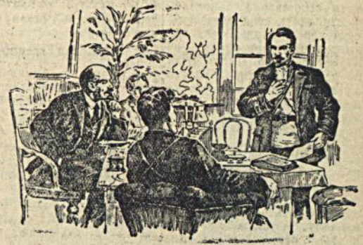
В. И. Ленин слушает доклад Н. А. Щорса (Кремль, 1918) г.