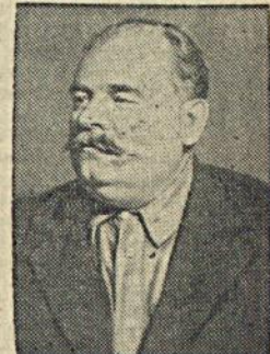
Председатель Президиума Верховного Совета РСФСР тов. А. Е. Бадаев