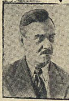
На снимке: Председатель Совета Народных Комиссаров РСФСР Николай Александрович Булганин