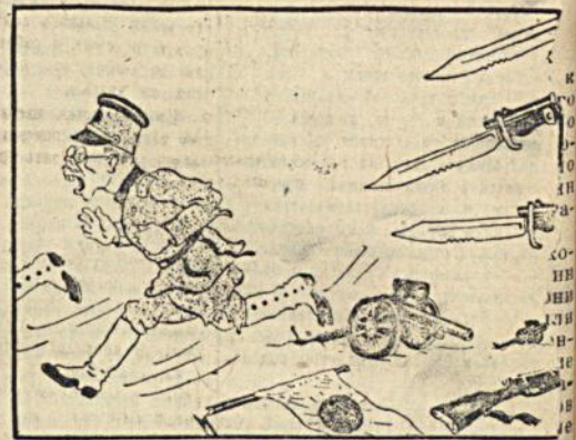
На поле битвы они бросают пушки и винтовки.