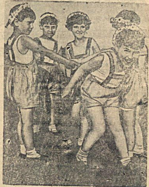
На снимке: Группа испанских детей за игрой. Фото А. Грибовского (Союзфото) „Прессклише“.

12 июня в детском доме № 5 для детей героического испанского народа (ст. Обнинская, Киевской железной дороги) состоялся замечательный праздник, посвященный окончанию учебного года и первой годовщине пребывания испанских детей в СССР.