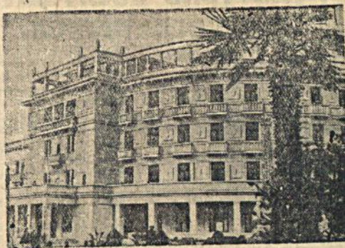
На снимке: Заключившаяся строительством новая гостиница на Приморском бульваре в столице Абхазии—Сухуми.