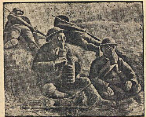
На снимке: Бойцы китайской армии на позиции