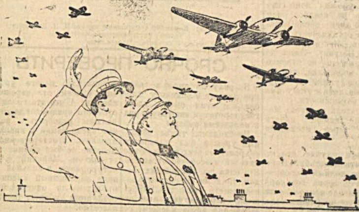
Перерисовка художника Н. Денисова с плаката художника Н. Денисова и Н. Ватолиной.