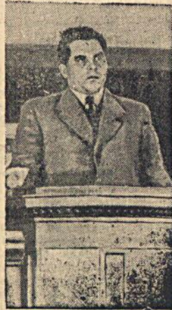
На снимке: Нарком финансов СССР А. Г. Зверев выступает с докладом.