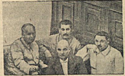
На снимке: Товарищи И. В. Сталин, А. А. Жданов, Н. С. Хрущев и М. Ф. Шкирятов в ложе Президиума Верховного Совета СССР.