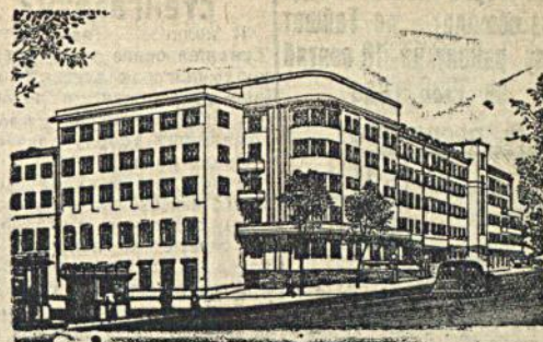
На рис. Гостиница «Москва». (Вид с Манежной площади)

Рис. с фото Н. Кубеева (Союзфото) «Прессклише»