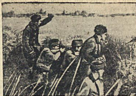
На св. Отряд бойцов республиканской армии на передовых позициях