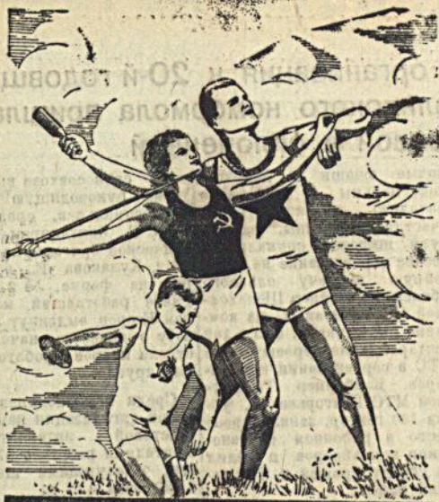
К ТРУДУ И ОБОРОНЕ ГОТОВЫ!