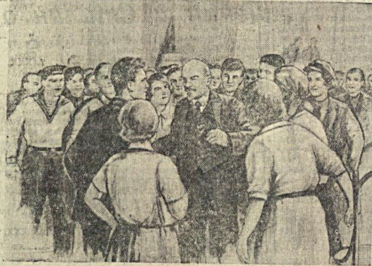
В. И. Ленин среди делегатов III съезда комсомола 1920 г.