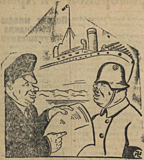
— Кто говорит, что мы снабжаем Франко? Мы снабжаем исключительно своих немецких солдат.