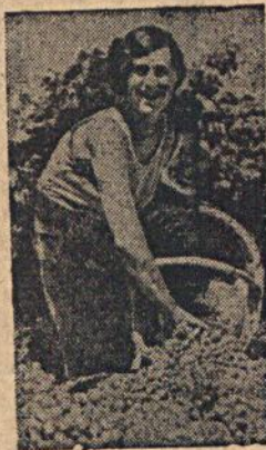
На снимке: Стахановка — рязица винограда Поля Полтавец с виноградом первого сорта.

Совхоз „Мысхао“ (Ново-российск) собирает в этом году урожай винограда п. 110 центнеров с гектара.