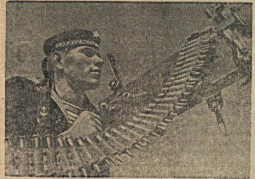
Пулеметчик Краснознаменной Амурской флотилии. Фото Д. Дебובה. (1-я Всесоюзная выставка фотоискусства).

Большевистская проверка исполнения решений отчетно-выборных собраний помогает крепить революционную бдительность коммунистов, ликвидировать последствия вредительства в партийной работе, улучшить работу по приему в партию, укрепить дисциплину, поднять идейное воспитание партийных масс, повысить качество партийно-политической работы.