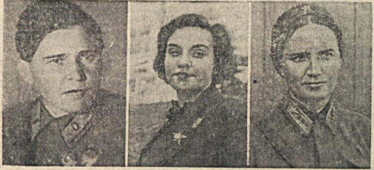
На св. (слева-направо): II-й пилот самолета „Родина“, капитан-орденоносец П. Д. Осипенко, командир экипажа, депутат Верховного Совета СССР, орденоносец В. С. Гризодубова, штурман самолета „Родина“, старший лейтенант-орденоносец М. М. Раскова.

24 сентября 1938 г. в 8 час. 12 мин. утра по московскому времени известные всей стране летчицы-орденоносцы Гризодубова Валентина Степановна, капитан Осипенко Полина Денисовна и старший лейтенант Раскова Марина Михайловна (штурман) вылетели в беспосадочный перелет из Москвы на Дальний Восток на двухмоторном самолете „Родина“. Героические летчицы блестяще завершили свой перелет.