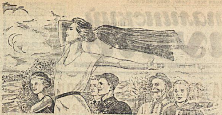
Плакат художницы Г. К. Шубиной. „Широка страна моя родная“, выпущенный Госуд. Издат. „Искусство“ к XXI годовщине Великой Октябрьской Социалистической Революции.

Колхозники также рассчитались с государством по денежным платежам. Они досрочно внесли деньги на заем третьей пятилетки (выпуска первого года). Мишин