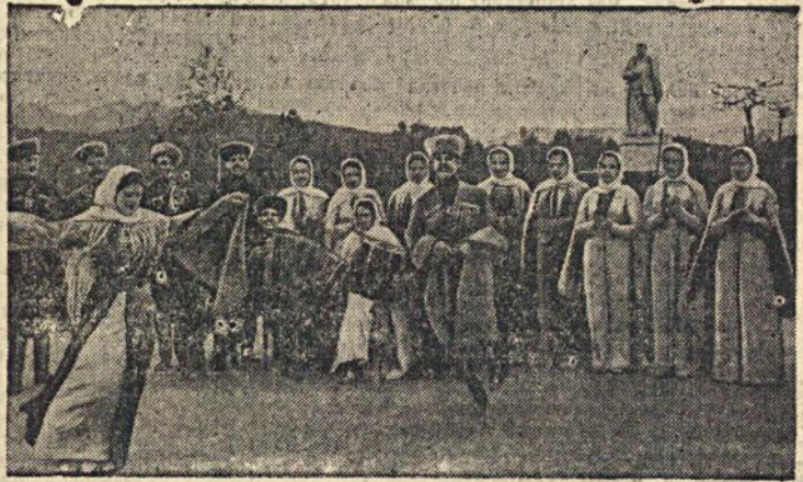
На снимке: Репетиция пляски. «Прескляше»

В Кабардино-Балкарской АССР создан ансамбль национальной песни и пляски.