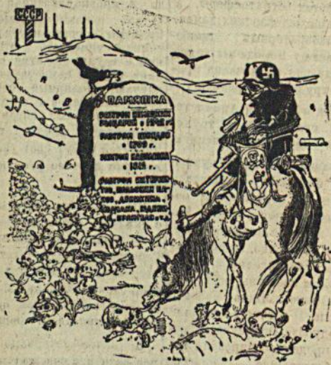
Размышления у придорожного камня. Рис. К. Теодоровича (Прескляше)

ряд районов, со всеми запасами сырья и оборудованием. Словацкое и украинское население, присоединяемых к Венгрии районах, составляет большинство. Решение «арбитражной комиссии» наносит непоправимый удар экономике Словакии, Закарпатской Украины и всей Чехословакии. ТАСС