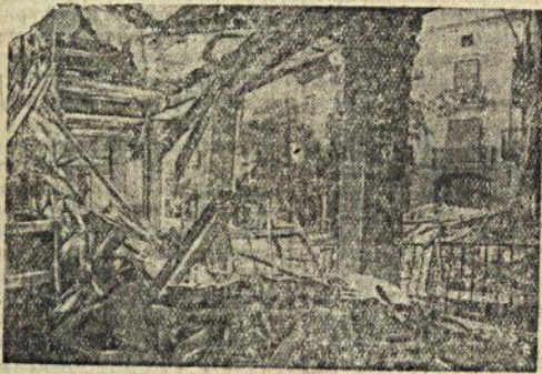
На сн.: Дома, разрушенные бомбардировкой италогерманских самолетов, в одном из городов Каталонии.