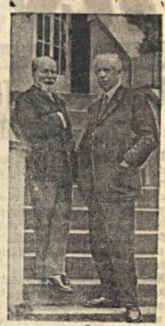
На снимке (справа вверху): Опователи МХАТ—народный артист СССР К. С. Станиславский и народный артист СССР В. И. Немирович-Давченко.

27-го октября исполнилось 40 лет со дня основания Московского орден Ленина Художественного Академического театра им. Горького.