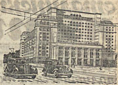
На рис: Гостиница „Москва“ (Вид с Малейной площади).