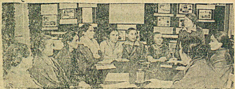
Очередное занятие кружка партийной учебы.

На Ленинградской текстильной фабрике им. Ногина для старых производственников партийцев создан кружок партийной учебы. В кружке, кроме рабочих фабрики, занимаются также бывшие работницы, ныне перешедшие на пенсию.