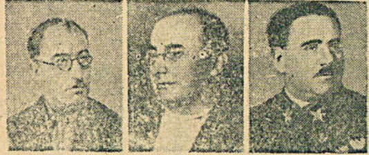
М. Д. Багиров. Л. П. Берия. В. К. Блюхер.