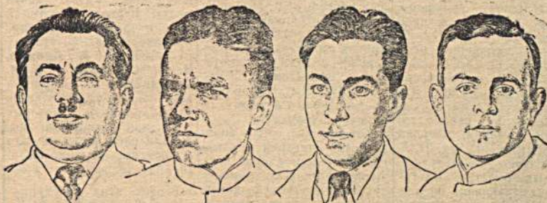
Слева направо: начальник дрейфующей станции т. И. Д. Папанин, радист т. Э. Т. Кренкель, магнитолог-астроном т. Е. К. Федоров, гидролог и гидробиолог т. П. П. Ширшов