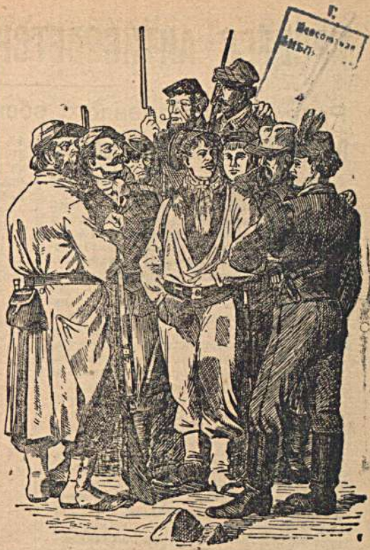
Типы коммунаров Парижской коммуны 1871 г.

Но трудящиеся Советского Союза стоят на страже завоеваний социализма, они громят и выкорчевывают ослые гнезда фашистской агентуры и еще больше усиливают мощь и обороноспособность своей великой родины. (Спутник агитатора № 4)