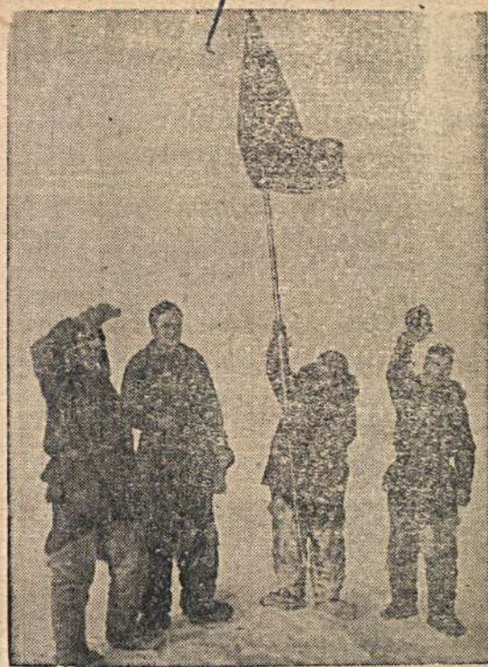
(Слева направо) гг. ШИШОВ, КРЕНКЕЛЬ, ПАПАНИН и ФЕДОРОВ приветствуют экипаж и кораблей «ТАЙМЯР» и «МУРМАН»