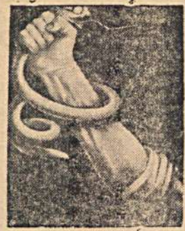
«Искореним шпионов и диверсантов, троцкистско-бухаринских агентов фашизма».

Злодей просчитались! Несмотря на вредительство и измены наша могучая страна, под руководством великого Сталина, продолжает свое триумфальное шествие к коммунизму. Никакая сила в мире не