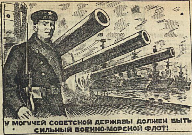
У МОГУЧЕЙ СОВЕТСКОЙ ДЕРЖАВЫ ДОЛЖЕН БЫТЬ СИЛЬНЫЙ ВОЕННО-МОРСКОЙ ФЛОТ!

Рисунок с плаката работы художника Венециана, выпущенный издательством «Искра-Сетов».