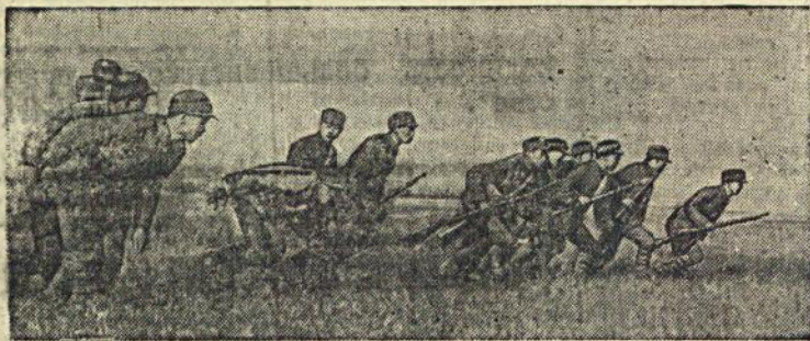
На сп. Бойцы народно-революционной армии Китая идут в наступление.