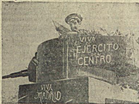
На сн.: Танкет республиканской армии. На танке надпись: «Да здравствует Армия Центрального фронта». «Да здравствует Мадрид»