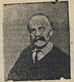
На снимке: Пьер Дегейтер— автор музыки к гимну „Интернационал“.